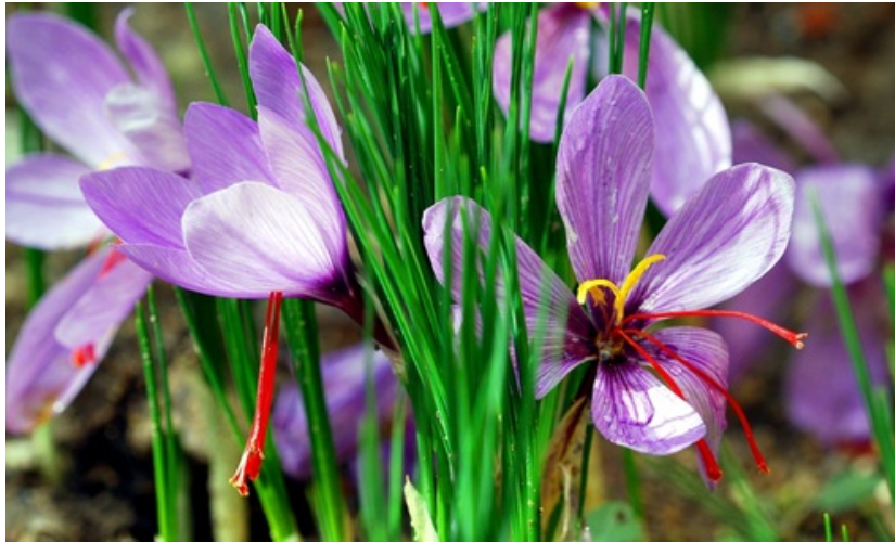
I fiori di Zafferano